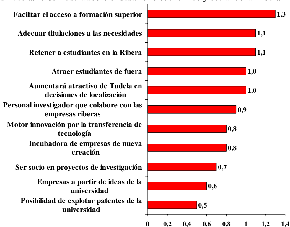
Gráfico 3: Opinión de los gerentes de empresas acerca de los efectos del campus univesitario de Tudela sobre el desarrollo económico y social de la Ribera