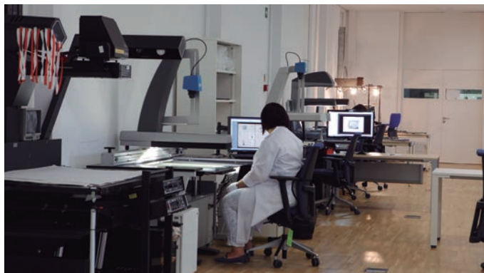
Vista general de la sala de digitalización.