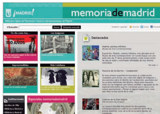
Detalle de la página web.

L a Biblioteca Digital memoriademadrid nació en 2008 con el propósito de digitalizar la documentación histórica que custodia el Ayuntamiento de Madrid. Desde esa fecha, ha formado una importante colección digital en la que se encuentran representados fondos de naturaleza tan distinta como los conservados en los archivos, bibliotecas o museos del Ayuntamiento, intentando establecer relaciones entre ellos para lograr una visión global del patrimonio histórico municipal.