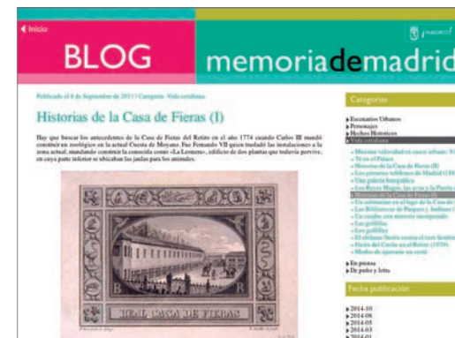
Blog de la Biblioteca Digital.

De igual modo la Biblioteca Digital participa de manera activa en la difusión de las colecciones pertenecientes al patrimonio cultural de la ciudad de Madrid a través de las redes sociales. Facebook, Twitter o Youtube son los canales en los