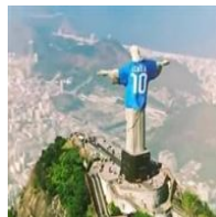
Archidiócesis de Río pide 7 millones de...