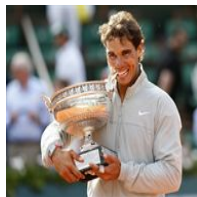
Nadal continúa forjando su leyenda en París