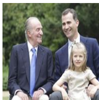
La Infanta Leonor recibirá formación militar...