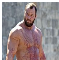
Juego de tronos: La Montaña se transforma en el...