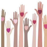
Los beneficios del altruismo