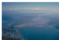
King County, Washington State, United States