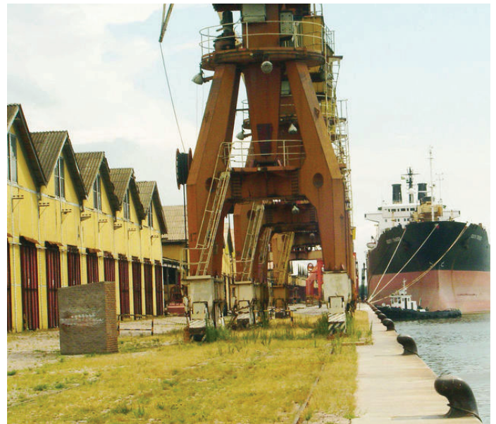
Porto Alegre, Brasil