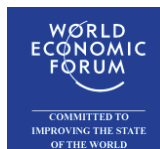
World Economic Forum (WEF)