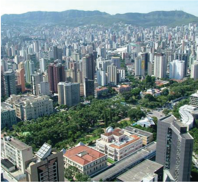
Belo Horizonte, Brazil

Es probable que el Estado de Desempeño sea verificado a través de un proceso similar al que se usa actualmente para verificar los estados financieros anuales.