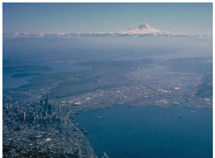
King County, Washington State, United States

Las universidades, las organizaciones no gubernamentales y los auditores profesionales podrían calificar para verificar las declaraciones de desempeño anuales.