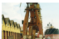
Porto Alegre, Brasil