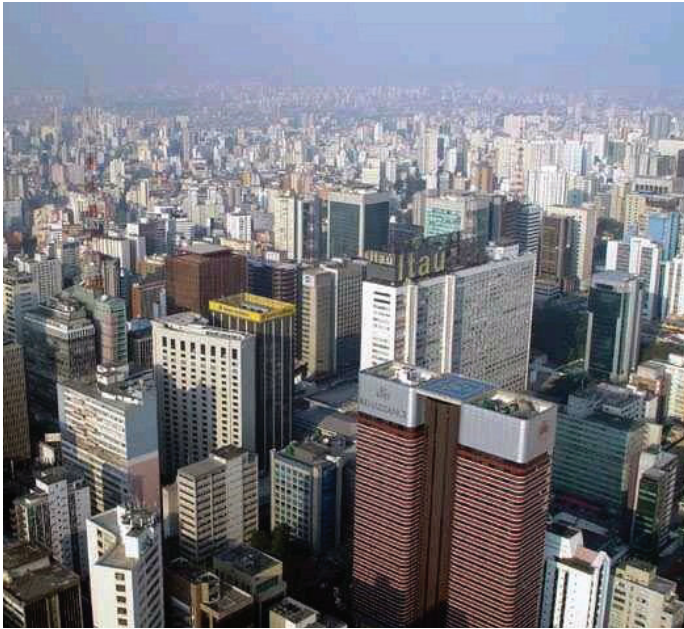
Sao Paulo, Brasil

A través de una extensa consulta y colaboración entre las ciudades socias, este Programa de Indicadores Globales propone un grupo de indicadores y procesos de ciudades con su continua actualización. Las ciudades se comprometieron activamente y participaron en la preparación, revisión crítica y refinamiento del Documento de Discusión Inicial; la selección y el desarrollo de los indicadores de ciudad, la definición y la metodología de los indicadores de la metodología y la modalidad de reportes, así como la prueba final del programa para demostrar y reformar su desempeño. Se espera que este proceso de refinamiento continúe y que todas las ciudades participantes sugieran revisiones regulares.