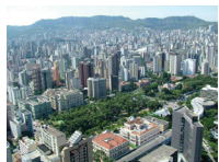
Belo Horizonte, Brasil