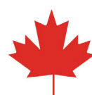
Government of Canada