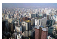
São Paulo, Brasil