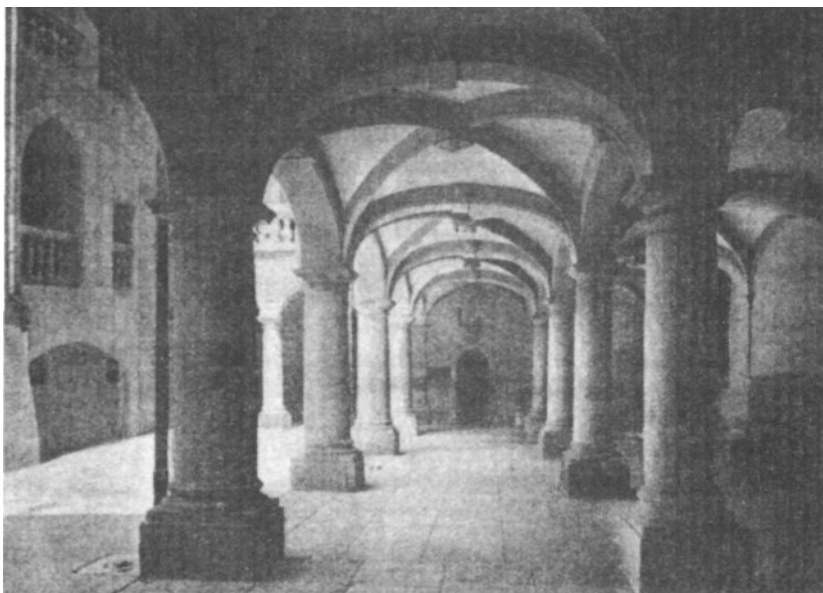
Sótanos del obispado de Ginebra y al fondo el calabozo donde fue encerrado Servet.

Esta sospecha que viene al pensamiento sobre la ilegitimidad del nacimiento de Servet se hace más consistente si consideramos que no es