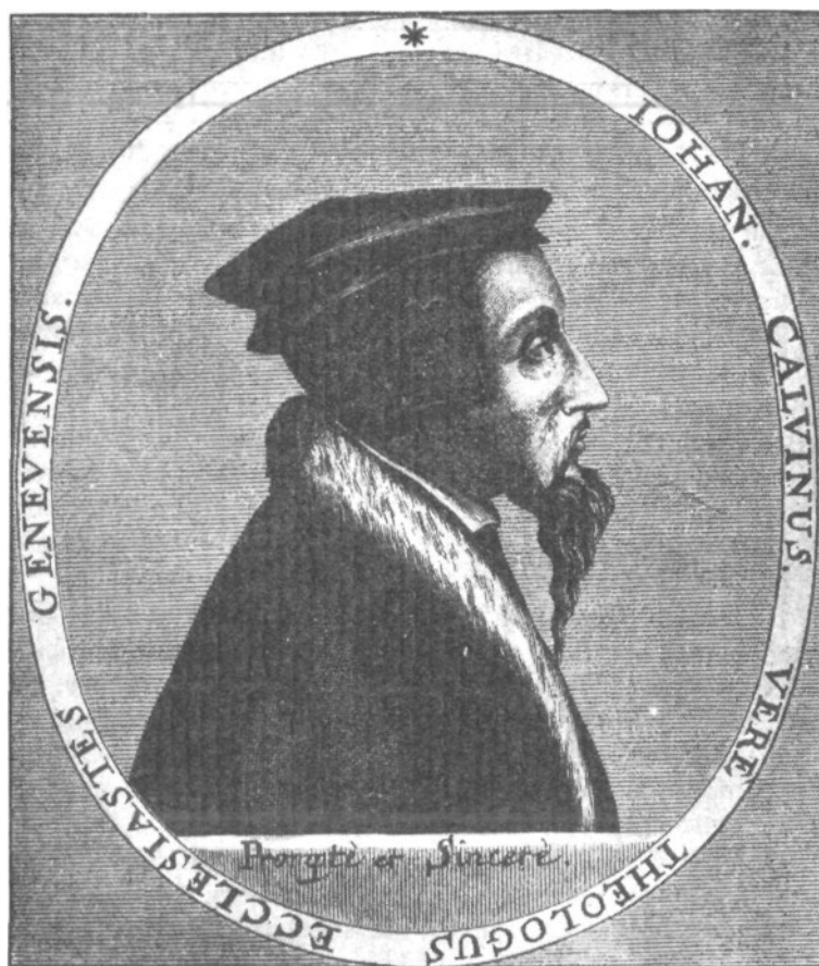
Juan Calvino. El gran enemigo de Miguel Servet nació en Noyun (Francia) en 1509 y murió en Ginebra en 1564.

un mal menor; era, simplemente, un heresiarca protestante; para los protestantes el mal era doble, porque Servet no sólo arruinaba el cristianismo, sino que justificaba en contra del protestantismo todas las acusaciones de los católicos» 32 Servet lleva la doctrina de Lutero hasta las últimas consecuencias. Los calvinistas, todavía, conservan el odio a Servet; sin embargo los católicos lo juzgan con misericordia, que en el mayor fiscal de nuestros heterodoxos, Menéndez y Pelayo y en una de sus mejores páginas de su Historia de los Heterodoxos Españoles se comprueba con toda evidencia.