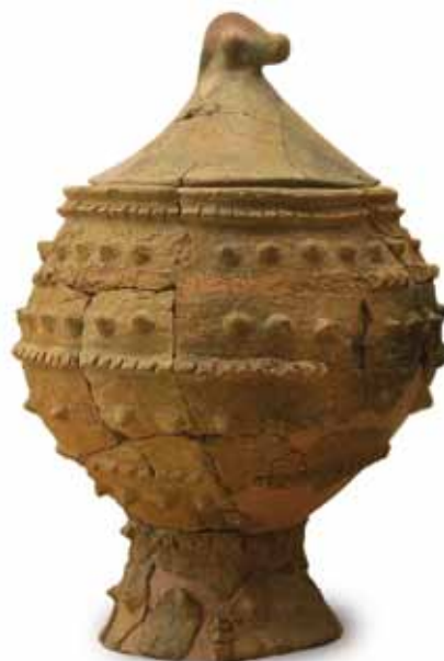
Fig. 3. Urna funeraria de I Edad del Hierro (siglos V-IV a. C.). Necrópolis «El Castillo» (Castejón, Navarra).

Tras la crisis del Imperio en el siglo III d. C., las poblaciones de la zona entran en decadencia económica, unida a una inestabilidad social provocada por las primeras invasiones bárbaras y la presencia de bandas organizadas de maleantes, los denominados Bagaudas. Los