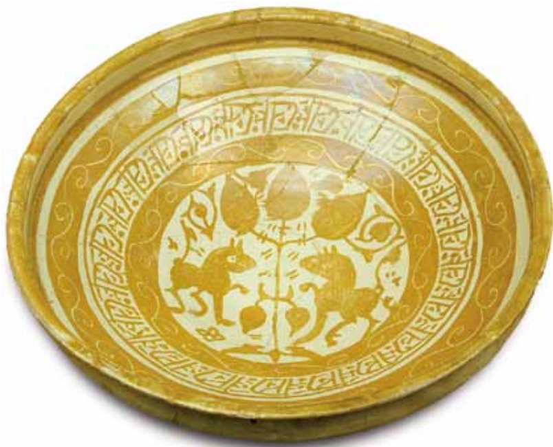
Fig. 5. Ataifor de loza dorada (siglos XI-XII). Cerámica islámica de reflejo metálico con decoración esgrafiada. (Tudela, Navarra).

descartándose que pudiera haber un centro de fabricación junto con los de otros tipos de cerámicas que sí han sido localizados.