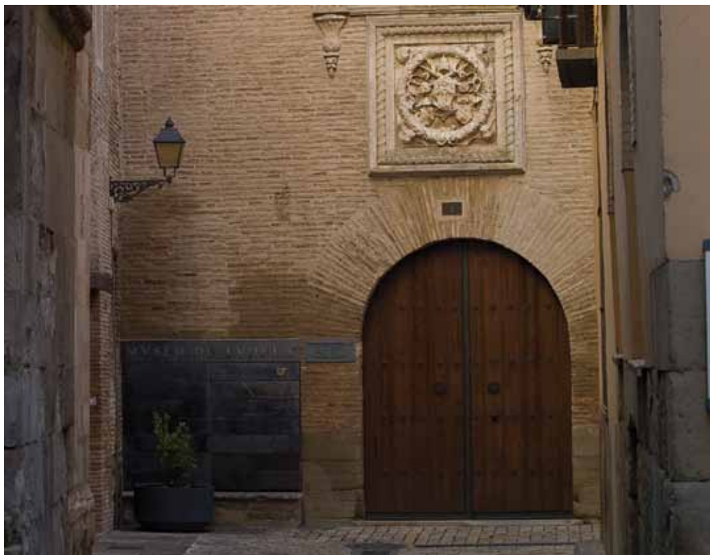
Fig. 1. Fachada del Palacio Decanal C/ Roso. Entrada al Museo de Tudela.

El Museo de Tudela tiene un ámbito de carácter urbano local. No obstante, Tudela, dada su influencia en un entorno geográfico importante, adquiere un carácter más comarcal que meramente local, como se testimonia en su exposición arqueológica que descubre vestigios de la Ribera de Navarra y da un valor añadido a su colección. Su singularidad viene determinada por su propia génesis. Se concibió como la organización que debía velar por la defensa, la conservación y difusión del patrimonio de la ciudad, principalmente religioso y sacro, al tiempo que debía promover su estudio e investigación.