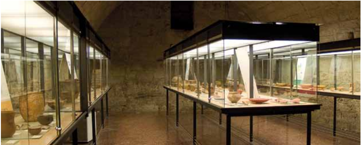
Fig. 2. Bodega, sala de arqueología del Museo de Tudela.

El centro de referencia de la arqueología foral es el Museo de Navarra ya que en él se exhiben sus piezas más representativas; tras él se encuentra el Museo de Tudela, institución donde se puede contemplar una variada e interesante colección de arqueología, testigo de un amplio periodo histórico en nuestra región. En su entorno existen además otros Museos o colecciones museográficas con muestras más específicas, como el Museo de Castejón, el Museo y Yacimiento Las Eretas de Berbinzana, el Museo de la ciudad romana de Andelos ó la Villa Romana de Arellano. (Armendáriz, 2013).