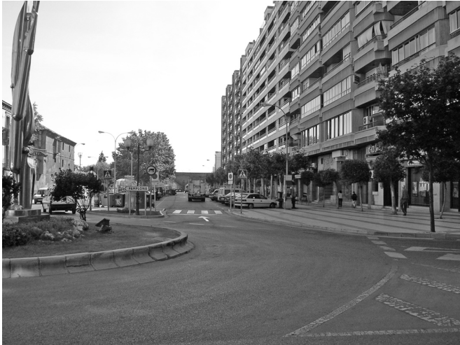
Figura 4: Aspecto actual del Paseo de Pamplona

En cuanto a las nuevas edificaciones y el paisaje resultante, en el solar que antes ocupaba el Teatro Cervantes, en la parcela más cercana al puente del ferrocarril, se construyó un edificio de 202 viviendas y locales comerciales con un total de once plantas. Fue construido entre 1977 y 1979 por la empresa Ruiz Ortega , una de las constructoras más activas en la ciudad durante los 70.