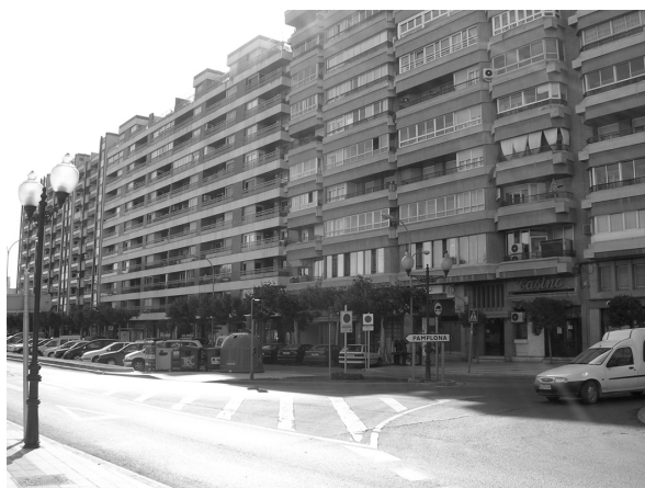
Figura 6: Aspecto actual del Paseo de Pamplona desde el mismo lugar que la fotografía anterior

Finalmente, en la parcela donde se preveía ubicar el edificio singular antes mencionado se construyó un bloque de 55 viviendas entre los años 1976 y 1978, de similar aspecto al edificio sede del Casino Tudelano pero adaptándose al chafalán entre las tres calles citadas.