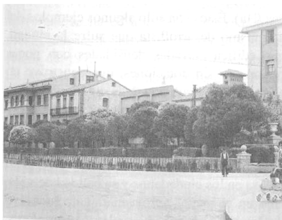
Figura 5: Otra imagen del Paseo de Pamplona antes de su remodelación (Fuente: Ramírez, Jesús María, "Una aproximación a la historia del urbanismo de Tudela", Revista del Centro de estudios Merindad de Tudela , 2005).