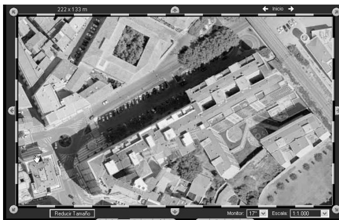
Figura 3: Foto aérea actual del Paseo de Pamplona. (Fuente: SITNA).

Tras la urbanización, la margen derecha del Paseo quedó transformada en un área de aparcamiento, separada de la carretera de salida hacia Pamplona por una mediana en la que fueron plantados varios árboles y cuya fisonomía aún perdura.