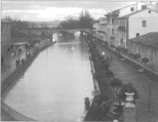
Figura 1: El Paseo de Pamplona antes del cubrimiento.

En 1949 se colocaron en el Paseo columnas rematadas con maceteros, tinajas tipo ánfora de barro rojo y bancos, y se plantaron nuevos árboles, lo que le dio el aspecto con el que aparece en las fotos de la época hasta el cubrimiento (Figura 1). El río dividía el Paseo en dos y era necesario atravesar un puente de hierro para cruzarlo.